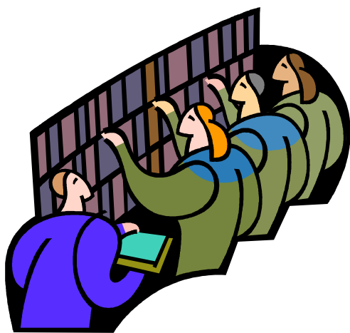
TABELA DA CDU _ EUGÉNIA (CLASSIFICAÇÃO DECIMAL UNIVERSAL)